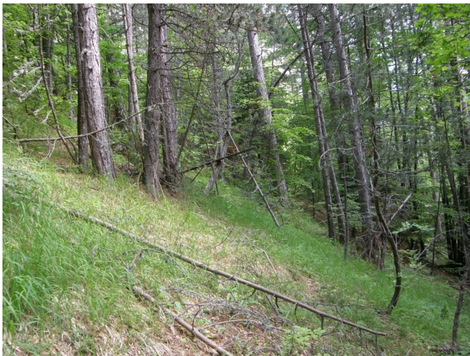
Добростански масив. Местообитание на вида. Юни 2014 г.