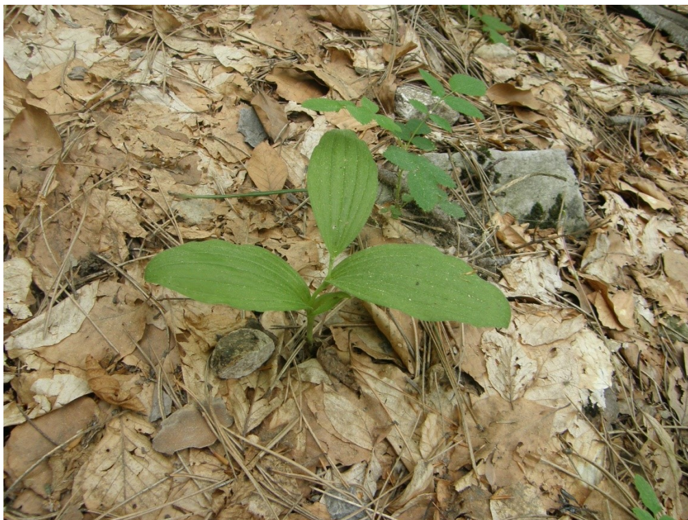
Доброостански масив. Екземпляр с единичен стрък, във вегетативно състояние. Юни 2012 г.