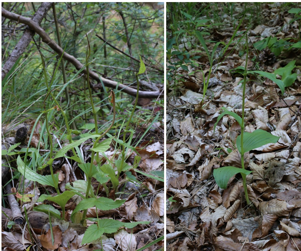
Изядени от охлюви (или насекоми) растения. Девинска планина, 07.2016 г.